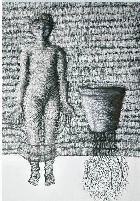
Dichotomie 29,7 x 21 cm