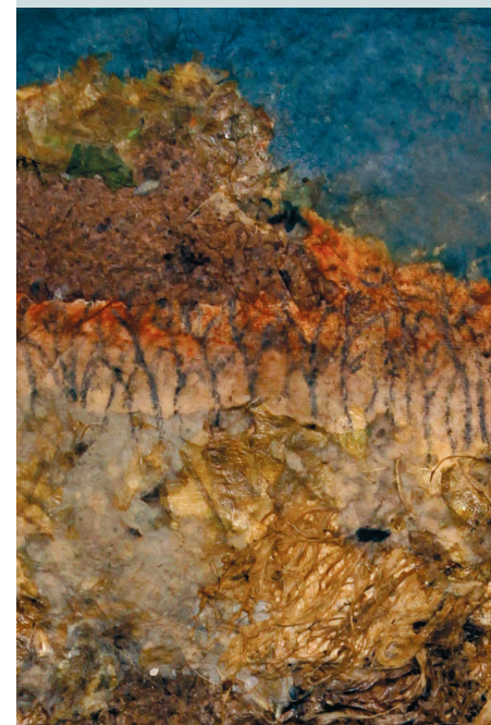
Paysage (détail) papier de plantes sur plexiglas

En préservant l'aspect organique des végétaux, les formes et leurs textures, j'invite le public à une contemplation de la beauté du monde naturel, et propose un dialogue intime avec le paysage, redonnant à la nature sa place centrale dans la réflexion sur l'homme et son milieu. Chaque œuvre est une invitation à ralentir et à observer le monde sous un angle inédit et jette un pont entre environnement et imagination. Les vastes étendues naturelles, qu'elles soient montagneuses, maritimes ou boisées, deviennent des espaces où l'homme, parfois dominé par l'immensité, se confronte à l'inconnu, à l'infini, face à une nature parfois tempétueuse, souvent majestueuse, empreinte de mystère et de sublime.