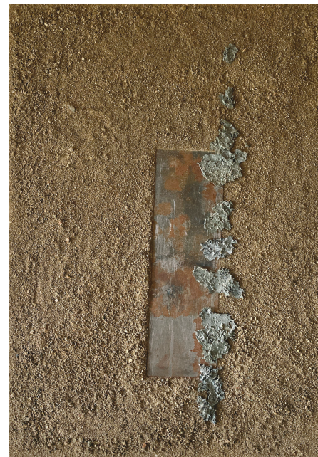
Rouille 70 x 50 cm. Sable, acier et zinc sur MDF