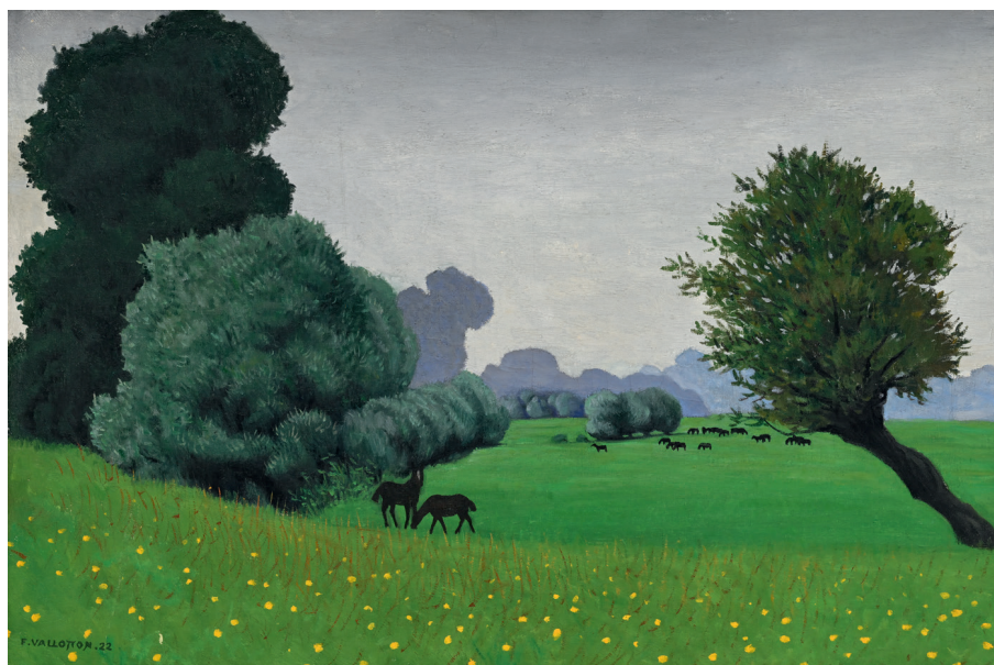
Félix Vallotton, 1922, huile sur toile, 54x81 cm