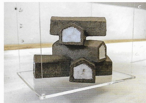
a/ David Gagnebin-de Bon, "Un album sans famille"